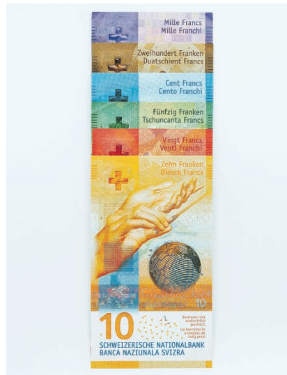
Das geht ab 2021 ins Geld...

Das Gesetz sieht keine Hinzurechnung lebzeitiger (herabsetzbarer oder ausgleichspflichtiger) Zuwendungen vor. Nach heutigem Kenntnisstand ist davon auszugehen, dass der Erblasser durch lebzeitige Zuwendungen seinen Nachlass soweit vermindern kann, dass dieser unter den Freibetrag von CHF 40 000.– fällt. Allerdings wird die selbstbewohnte Liegenschaft bei der Berechnung des Anspruchs auf Ergänzungsleistungen zum Steuerwert berücksichtigt, während sie bei der Berechnung des entässerten Vermögens zum Verkehrswert angerechnet wird. Dies führt dazu, dass die Abtretung einer selbstbewohnten Liegenschaft